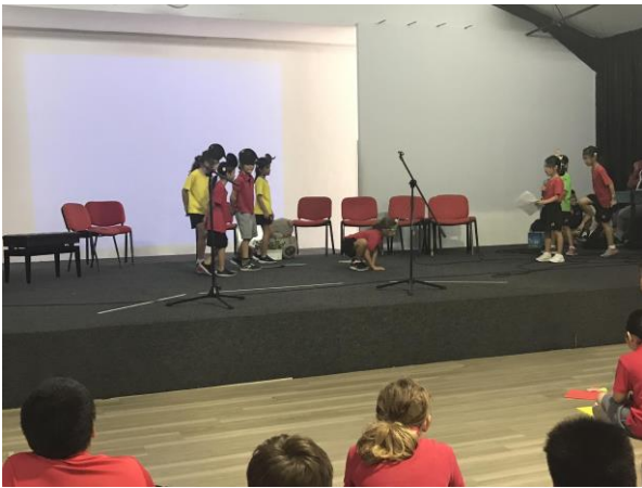
二年级的学生们为老师带了中文故事表演《小蝌蚪找妈妈》。来自荷兰的青蛙妈妈非常可爱，其他学生们的表演也惟妙惟肖。