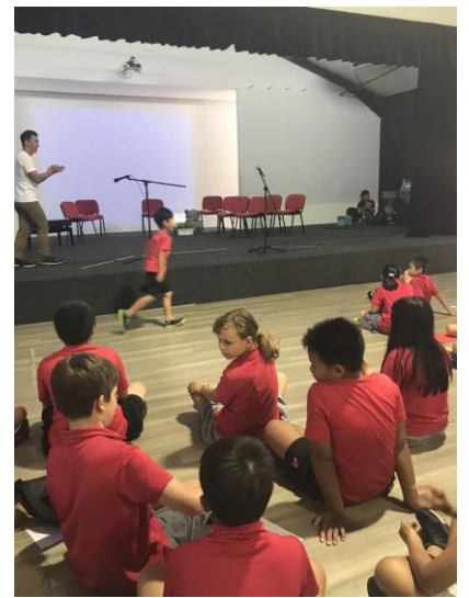
这位跑下舞台的小男孩，他刚刚完成了他的个人才艺展示---钢琴独奏。