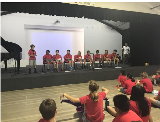
三年级的每位学生用一句话或几句话来形容老师们的谆谆教诲，最后用一个词语做总结。原来你们都是小才子啊！